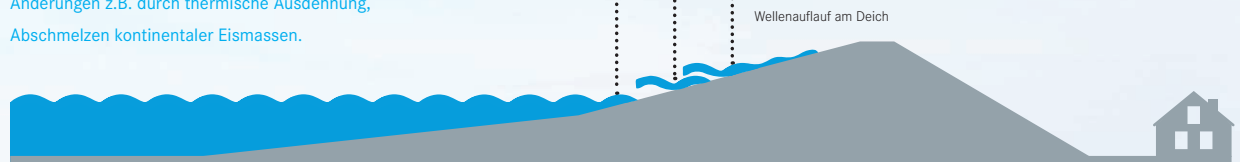
Abb. 1: Schematische Darstellung der Faktoren, die Sturmflutwasserstände beeinflussen können. Änderungen im globalen und regionalen Meeresspiegel beeinflussen sowohl die mittleren als auch die Sturmflutwasserstände. Änderungen im Windklima und Wellenauflauf sind dagegen nur für die Sturmflutwasserstände von Bedeutung.

Volumen der Ozeane. Änderungen z.B. durch thermische Ausdehnung, Abschmelzen kontinentaler Eismassen.